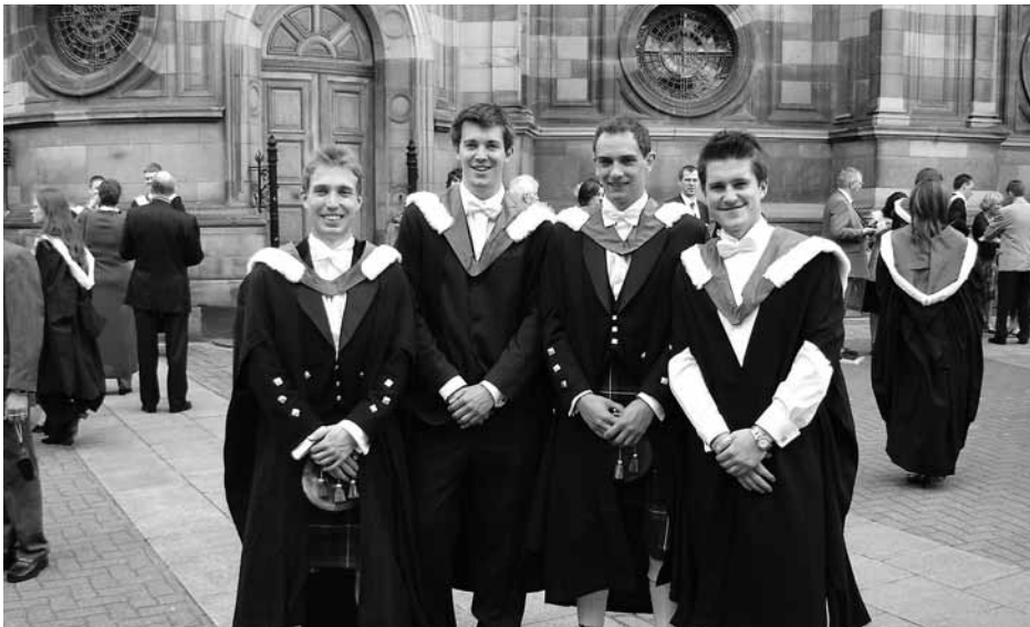
Graduation ceremony. University of Edinburgh, McEwan Hall outside, 2005. Edinburgh, Scotland

Беларусы ў асноўным едуць у Еўропу за рэальнымі ведамі, якія можна будзе прымяніць у нашай краіне. Найбольш папулярныя кірункі – бізнэс, эканоміка, ІТ, маркетынг, дызайн, права і інжынерныя спецыяльнасці.