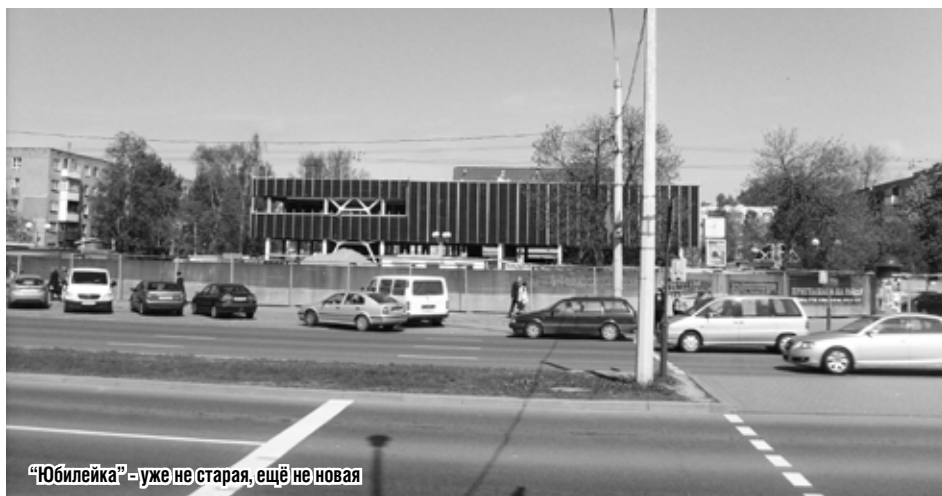
«Юбилейка» - уже не старая, ещё не новая

Впрочем, мы никогда и не утверждали, что во всех бытовых проблемах только одно слабое звено. Окружающий нас мир и наше собственное представление о том, каким он должен быть, тесно связаны и зависят друг от друга. Следите за собой, поправляйте других, и вместе мы сможем построить уютный и благополучный общий дом.