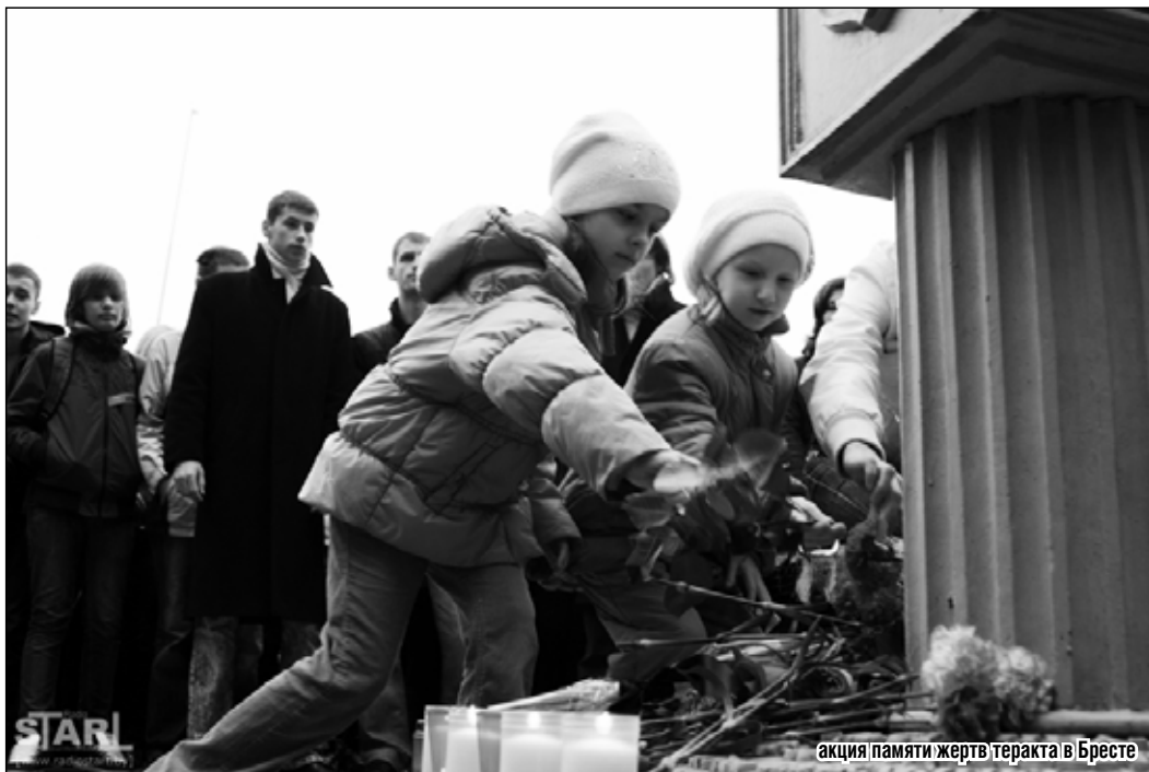
акция памяти жертв теракта в Бресте