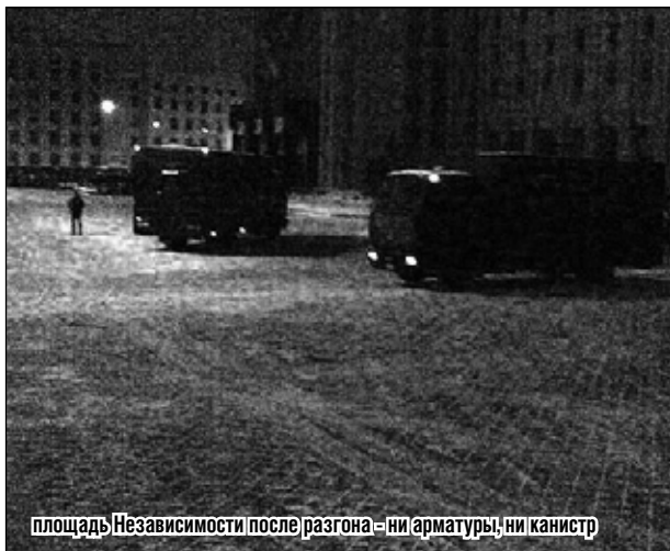
площадь Независимости после разгона — ни арматуры, ни канистр