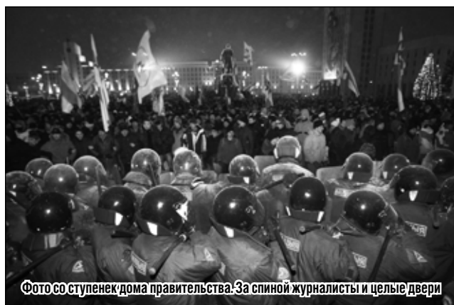
Фото со ступенек дома правительства: За спиной журналисты и целые двери

Что происходило на площади Независимости,