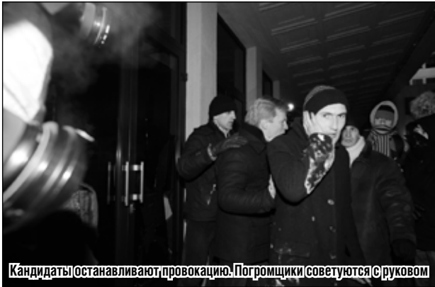
Кандидаты останавливают провокацию. Погромщики советуются с руковым

ности для дома правительства не было, однако сочных кадров для БТ вполне хватало.