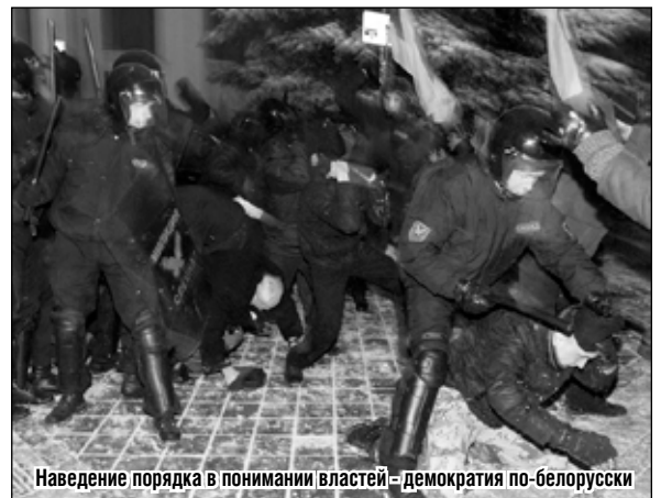
Наведение порядка в понимании властей – демократия по-белорусски