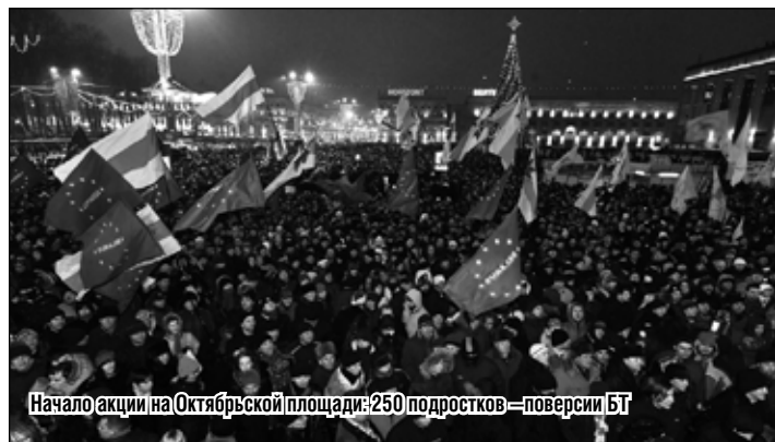
Начало акции на Октябрьской площади: 250 подростков — поверсии БТ

подсчёт голосов верили значительно меньше: в комиссиях - всё те же лица. Участие оппозиционных структур «в несколько раз выше», чем в 2006г. Тем не менее в процентном соотношении — эта цифра не превышает 0,02% от общего числа тех, кто решает судьбу страны.