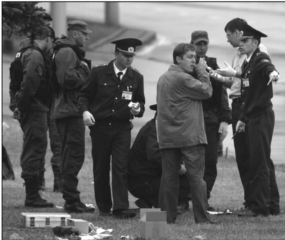
На фото: место взрыва, пр. Победителей, Минск, 4 июля 2008 года

В ночь с 3-его на 4-ое июля в Минске прогремел взрыв прямо в разгар гала-концерта по случаю Дня независимости. В тот самый момент, когда украинка Таисия Повалий затянула начало второго куплета своей песни, через дорогу от сцены в толпе сработало устройство, начиненное болтами и гайками.