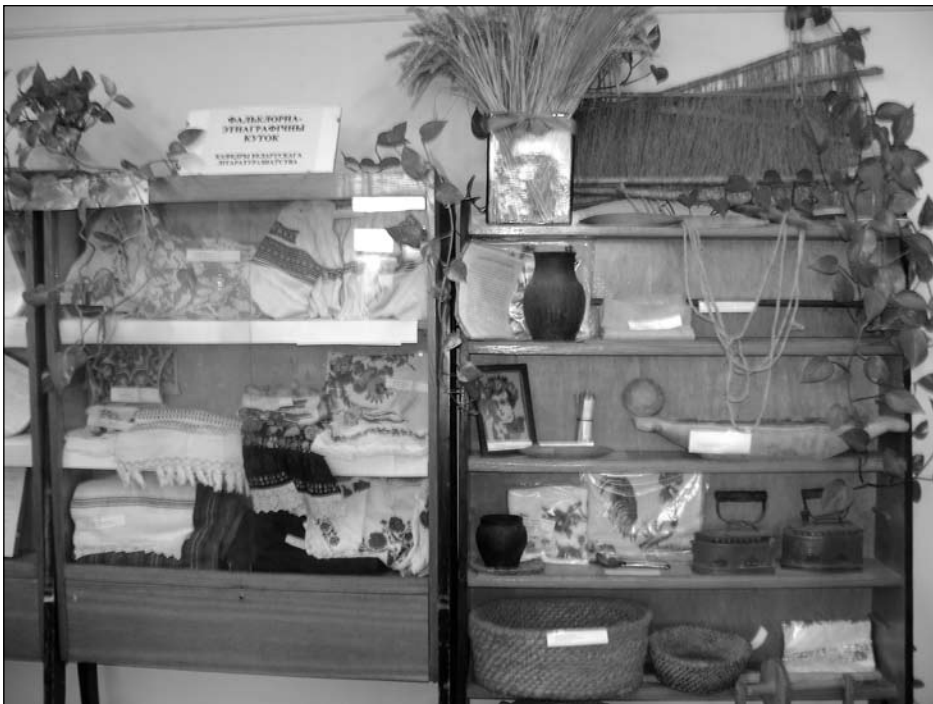
Філалагічны ф-т БРДУ. Кабінет беларускага літаратуразнаўства.