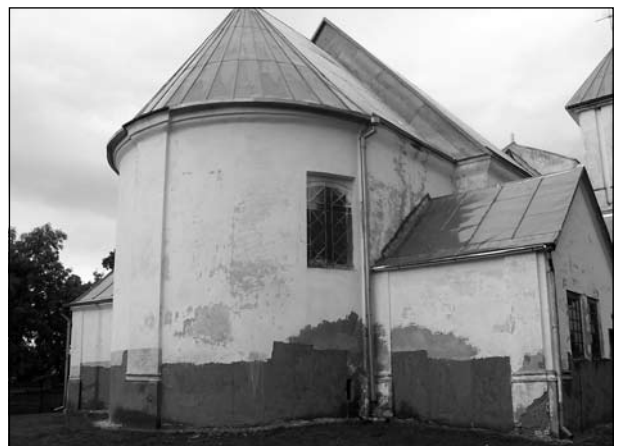
Касцёл св. Дзевы Марыі, в. Сягневічы