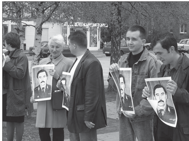
Падчас акцыі «Ланцуг неабыхавых людзей». Берасце, 7 траўня 2005г.

На пасту міністра Ю.Захаранка працаваў крыху больш за год. Пазней ён успамінаў: «Наверное, я остался адным из немногих, кто говорил Лукашенко правду. Ту правду, нехорошую правду, которая была по самолюбию президента, но я говорил ее... Когда мы разговаривали с президентом, он сказал мне: «Ты должен выполнить любой мой приказ». Я ему говорю: «Александр Григорьевич, людей расстреливать не буду, Конституцию нарушать не буду». А он тогда: «Если ты не выполнишь любой мой приказ, на тебя наденут наручники». Это стиль руководства президента».