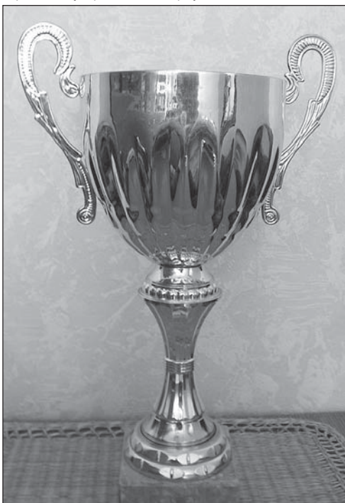
Кубак пераможцаў стаіць у кабінце дэкана геафака, сярод іншых адзнак майстэрства будучых географу

Фінальная сустрэча, якая была прызначана на 19 траўня, не адбылася, бо футбольнае поле СШ №9, дзе праходзілі спаборніцтвы, пасля начнога дажджу ператварылася ў вялікую лужыну, у якой хутчэй можна было праводзіць спаборніцтвы па вадным пола. Галоўны суддзя спаборніцтваў Сяргей Шмолік вынес рашэнне аб пераносе сустрэчы на 23 траўня.