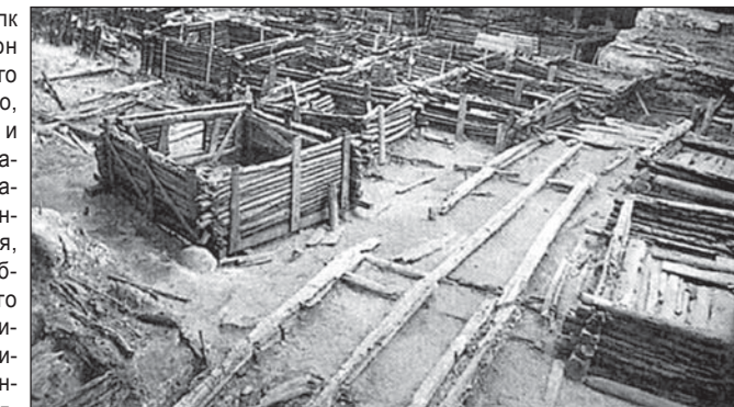
Рэшткі летаніснага Берасця XIIIст. можна сёння ўбачыць у музеі «Бярэсце»

Минула почти тысяча лет с тех пор, когда под Брестом небесная кара настигла изуверу Святополка, убийцу святых Бориса и Глеба. Но и сегодня мы отмечаем этот день торжества небесной справедливости как день рождения нашего города.