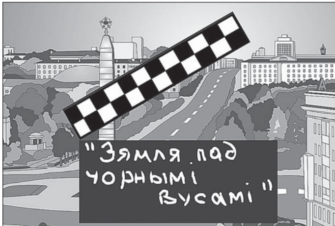
На фота: кадры з мультфільмаў, размешчаных на сайце «Трэці шлях»

Бадзяючыся ў пошуках цікавых інтэрнэт-сайтаў, прысвечаных краіне, у якой нам з вамі наканавана жыць, нека раптоўна рэдакцыя натрапіла на даволі спецыфічны віртуальны праект, прысвечаны грамадска-палітычнаму жыццю Беларусі. Сайт пад назвай "Трэці шлях" ( www.3dway.org ) зацікавіў, найперш, сваім прызначэннем і падыходам да існуючых праблем. Як заяўляюць аўтары праекта, "сайт скіраваны на аб'яднанне людзей, якія падзяляюць дэмакратычныя погляды... дзеля знаёмства і сумесных дзеянняў, скіраваных на папулярнызацыю нашых ідэй і абарону агульных інтарэсаў".