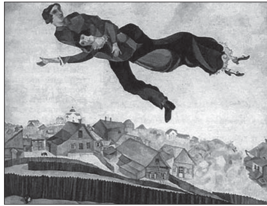
М.Шагала «Закаханыя над горадам»

У 1941г., чужым выраўшыся з рук фашыстаў у акупаванай імі частцы Францыі, ён апынуўся ў ЗША. Даведаўшыся пра лёс роднага горада, які за гады фашысцкай акупацыі быў ушчэнт разбураны і згубіў амаль усё насельніцтва, Шагала напісаў "Ліст майму роднаму Віцебску", які быў апублікаваны ў адной з амерыканскіх габрэйскіх газет.