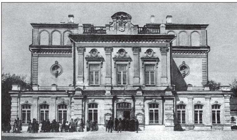
Менскі гарадскі тэатр (цяпер Нацыянальны тэатр ім. Я.Купалы), дзе распачаў свае пасяджэнні Першы Усебеларускі кангрэс.

Гэта адна з прычын таго, што аўтанамісты ва ўрадзе БНР 23 сакавіка апынуліся ў меншынці. Другая прычына, як успамінаў Антон Луцкевіч, заснавальнік і відны дзеяч БСГ, – у адсутнасці грошай. Грошы меўся пазычыць урад Украіны. Але каму? Беларускай дзяржаве ці акупаванай част-