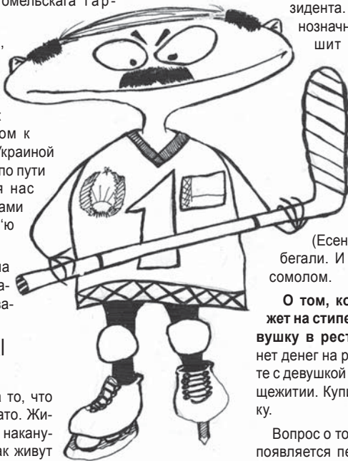
Новы кумір – БАЦЯНЯ

Народ белорусский рискнул и избрал меня Президентом. Это бывает чрезвычайно редко в истории и больше, возможно, не будет.