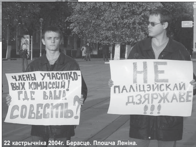
22 кастрычніка 2004г. Берасце. Плошча Леніна.

Тыя колькі дзесяткаў чалавек, якія выйшлі на гэты пікет – не фанатыкі і не прыдуркі. Яны проста ведаюць свае правы і не прытрымліваюцца той філасофіі, якая так пашырана ў нашым грамадстве – філасофіі мышы пад мятлой. Пагадзіцеся, ужо адно гэта заслугоўвае павагі. Доўжыўся, праўда, пікет ўсяго каля 20 хвілін, бо сярод пікетуючых было шмат студэнтаў, а ў нашы часы вылецець з універсітэту за "паліцічаскую дзеецельнасць" зусім нескладана.