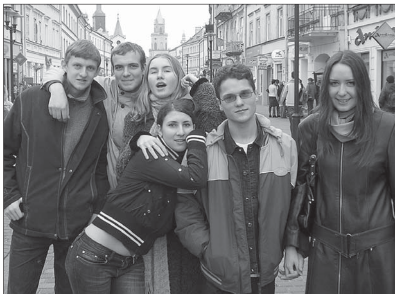
Прадстаўнікі «Дзедзіча» у Любліне сумяшчалі навучанне з культурнай праграмай