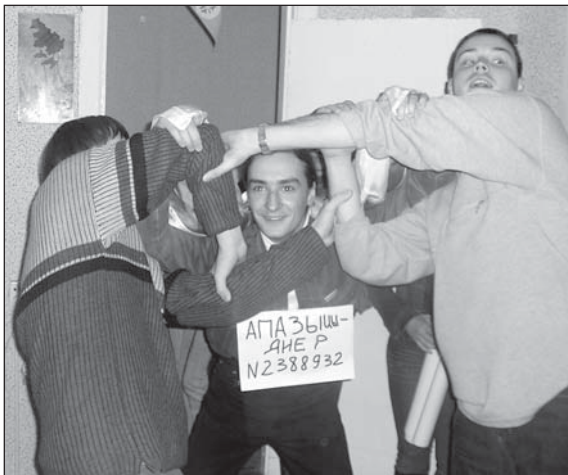
«Дзедзіч» святкуе юбілей

Актыўная грамадзянская пазіцыя "дзедзічаў" паўплывала на пазітыўнае стаўленне да нас з боку жыхароў горада, якія дзякуюць за акцыі па паляпшэнні эстэтычнага выгляду двароў горада, нас падтрымліваюць знакамітыя дзеячы беларускай культуры. Гэтае разуменне патрэбнасці грамадству натхняе нас на ўсё новае і новыя карысныя справы. Будзем рабіць Беларусь квітнеючай краінай разам!