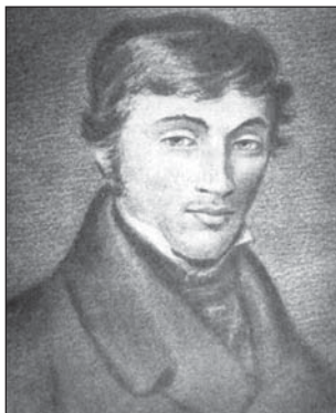
А.Міцкевіч. З партрэта Я.Аляшкевіча.

1798г. нарадзіўся яшчэ адзін наш зямляк – вялікі паэт Адам Міцкевіч , аўтар слаўтай паэмы "Пан Тадэвуш". З'явіўся на свет Адам Міцкевіч на хутары Завоссе каля Наваградка. У Наваградку скончыў школу і паступіў у Віленскі ўніверсітэт. І пачалося ягонае багаце на падзеі жыццё. Адам Міцкевіч надта любіў і цаніў Беларускаю мову. У сваёй лекцыі ў Калеж-дэ-Франс у Парыжы ён назваў Беларускаю мову самай гарманічнай і з усіх славянскіх моваў найменш змененай. Праўда, пісаў свае вершы Міцкевіч па-польску, бо пальшчызна ў ягоны час была прызнанай літаратурнай мовай, а Беларускаю заставалася доляю фалькларыстаў і этнографу.