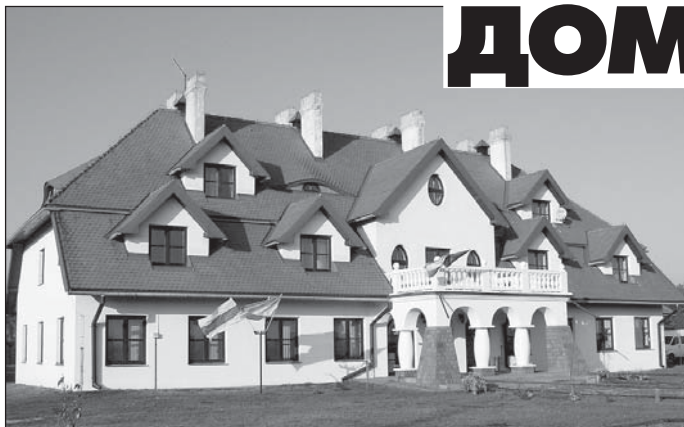
Еўрапейскі дом спатканняў належыць фундацыі «Новы стаў» (Люблін). Сустрэчы, семінары, імпрэзы для моладзі з розных краін Еўропы адбываюцца адна за адной - бесперапынна.

Гэты асяродак знаходзіцца ва ўласнасці адной з актыўна дзеючых грамадскіх арганізацый Люблінскага ваяводства – Фундацыі "Новы стаў". Ужо дзесяць гадоў "Новы стаў" працуе на карысць грамадзянскай супольнасці і салідарнасці паміж народамі, таму ад пачатку сваёй дзейнасці Фундацыя была адкрыта для кантактаў з прадстаўнікамі іншых народаў.