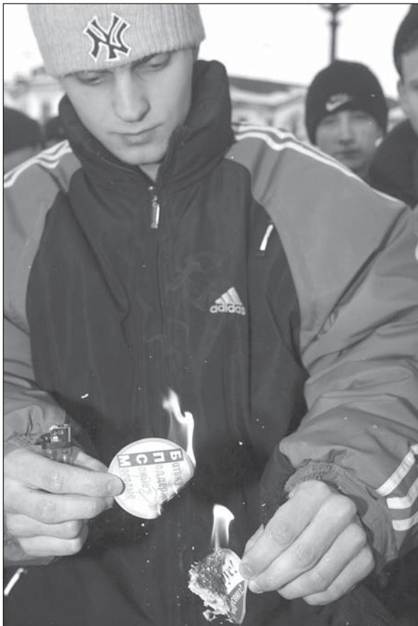
Акциі солідарнасці з моладзёжы Баранавіцкага колледжа правелі члены движенія «ЗУБР» в разных городах. На фото: актывісты ЗУБРА в г. Борисове сжигают агитационную продукцию БРСМ.