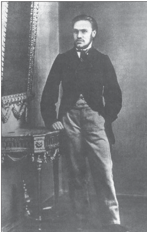
Гэты партрэт Кастуся Каліноўскага зрабіў у 1862г. яго папалечнік Ахіл Барнольдзі.