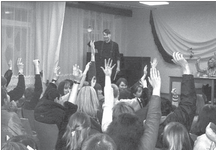
Общее собрание членов БРСМ Барановичского государственного колледжа лёгкой промышленности, на котором было принято решение о присоединении к движению «ЗУБР»

Подобный факт не вызывает особого удивления. Общеизвестно, что большинство "союзной