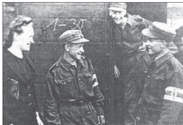
Маладыя вайскоўцы БКА перад адпраўкай на захад. Лета 1944.

З цягам часу рабілася ўсё больш відавочным, што немцы прайграюць вайну. Лінія фронту набліжалася. Дзеля гэтага некаторыя жаўнеры, жадаючы абяліць сябе і не стаць ахвярамі паваенных рэпрэсій, пачалі пераходзіць да партызан. Тая частка салдат, якая не хацела жыць у "савецкім раі" і жадала прадоўжыць барацьбу супраць бальшавізму, адступіла разам з нямецкім войскам.