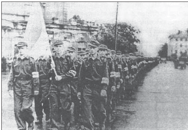
Выпускнікі камандзірскіх курсаў БКА падчас урачыстага маршу ля Менскага Беларускага тэатра (цяпер Нацыянальны акадэмічны тэатр імя Я. Купалы). Чэрвень 1944г.

Бліжэй да канца вайны, зразумеўшы, што Гітлер прайграе, дзечы Беларуская Цэнтральная Рада пачынаюць пераарыентацыю на Альянс, спадзеючыся, што пасля перамогі над Германіяй Англія і Злучаныя Штаты абвясцяць вайну СССР. Астроўскі з паплечнікамі чыняць розныя перашкоды, імкнучыся не дапусціць, каб беларусы трапілі жыццё ў барацьбе, якая пачынае рабіцца бессэнсоўнай. Ды і самі беларускія салдаты пры першай магчымасці імкнуцца перайсці на бок