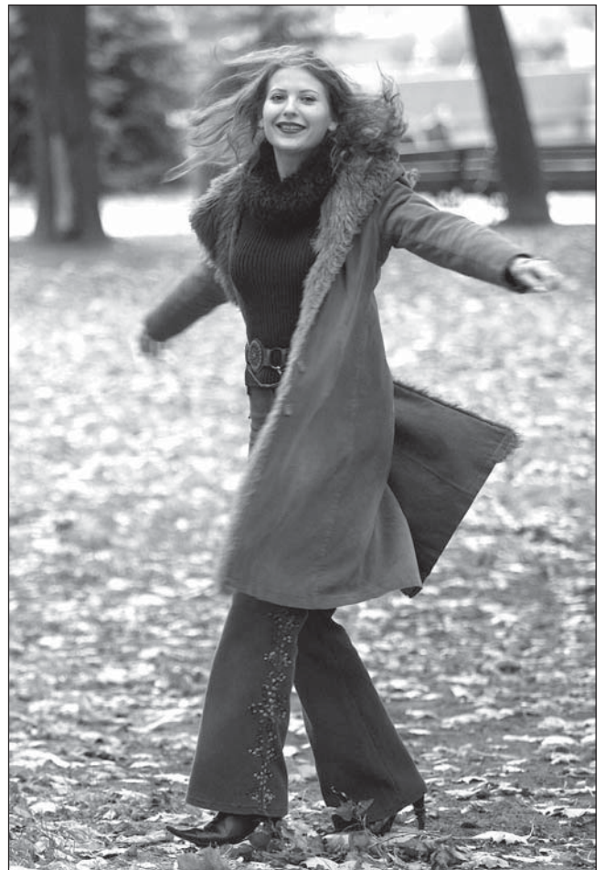
Залатая восень. Шчаслівая пара.

Шчаслівыя людзі лягчэй знаходзяць сяброў.