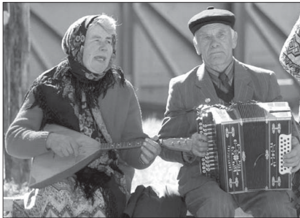
Дажынкi-2000 у Шклове. Ідылія на фоне галечы.