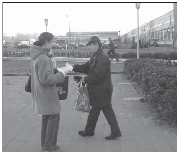
Раздача улёткаў-віншаванняў ля «Цветатрона» скончылася затрыманнем кіраўніка Берасцейскай гарадской арганізацыі Партыі БНФ.

філактыкі СНІД, адміністрацыі Парка культуры і адпачынку, БАМГА "Сузор'е".