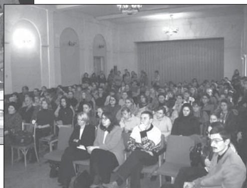
На сустрэчы з пісьменніцай. 2 снежня 2003г.

біліся ў аповесцях "Святаслава" (1984г.), "Агонь у жылах крэменю" (1987г.), рамане "Залатая жрыца Ашвінаў" (1997г.). В. Іпатава з'яўляецца аўтарам балад, нарысаў, п'ес, паэм, кніг для дзяцей. Выступае як крытык, публіцыст, перакладчык.