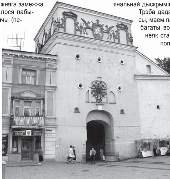
Вільня. Вострая Брама. Месца, дзе павінен пабываць кожны беларус.