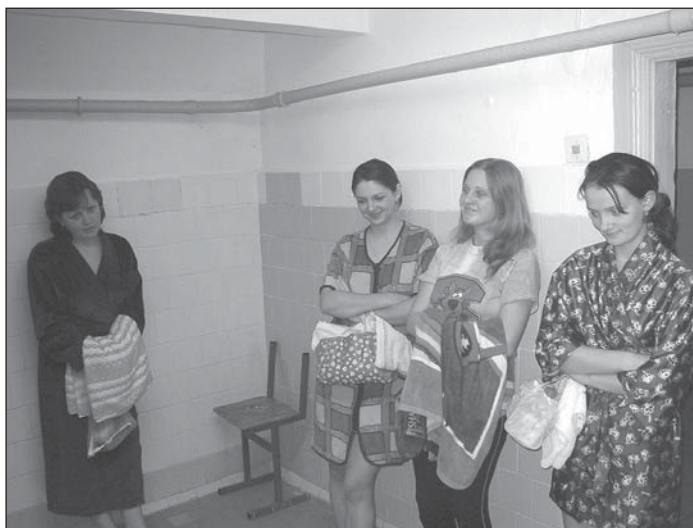
Чарга ў душавую. У гэты дзень (9 снежня) на «ленінцы» не было гарачай вады, таму яна такая маленькая.

P.S. Наведваючы з інспекцыяй інтэрнат на Рэчыцы, кіраўніцтва ўніверсітэта заўважыла ў кухні аднаго з паверхаў шмат смецця. І каб у наступны раз больш сачылі за парадкам, загадала зняць пліты, на якіх неахайнае студэнцтва гатавала ежу.