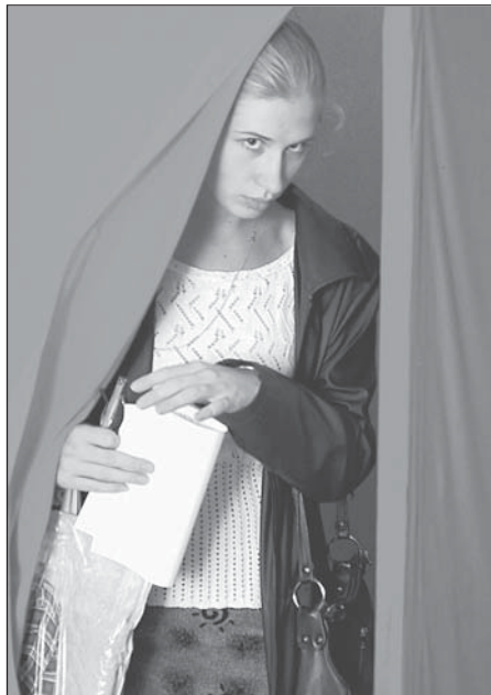
Голосу с надеждой...

Конечно, была жалоба в областной суд, были заседания, прения, допросы свидетелей. Разговорчивая и приветливая судья выказывала неподдельную заинтересованность в объективном рассмотрении дела. Но судей у нас назначают, а не выбирают, поэтому решением суда предупреждение было оставлено в силе. Снова-таки остаётся только надеяться на рассудительность чиновников Управления юстиции, которые могут состряпать в любой момент ещё одно предупреждение, а могут иногда закрыть глаза на то, что не имеет принципиального значения «для обеспечения стабильности в обществе».