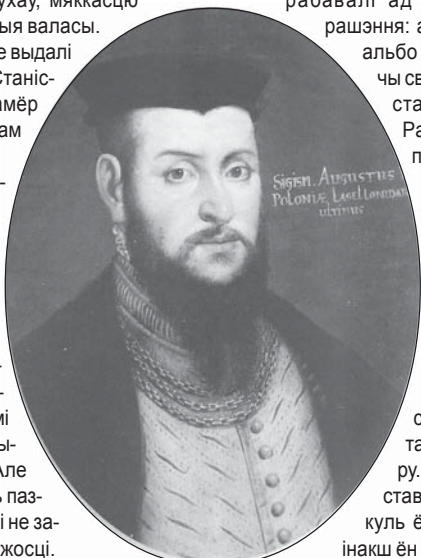
Жыгімонт II Аўгуст