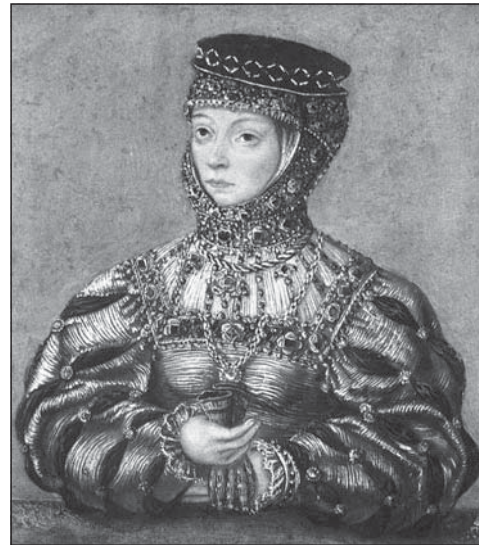
Барбара Радзівіл (мініяцюра з майстэрні Лукаса Крамака малодшага)

сягненні поспехаў ёй дапамагала незвычайная прыгажосць, якую каралева заўсёды магла і ўмела падкрэсліць.