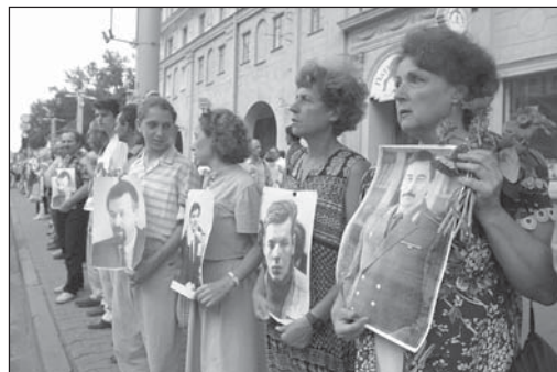
Акцыя «Ланцуг неабыхавых людзей»

У гэтай сітуацыі больш за ўсё шкада не ўдзельнікаў акцыі (яны ведалі, у якой краіне жываюць), а супрацоўнікаў міліцыі, якім прыходзіцца, нярэдка насуперак уласным перакананням, выконваць загады занадта "ретыўных" чыноўнікаў.