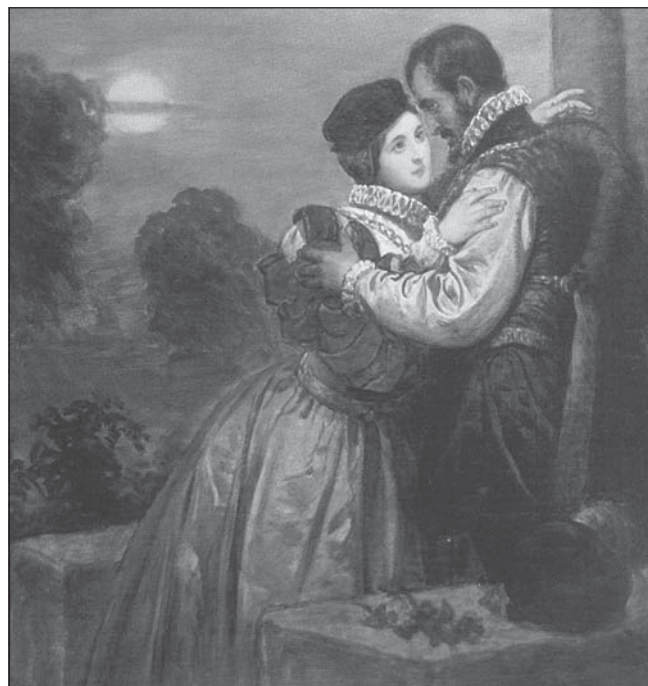
Барбара Радзівіл і Жыгімонт II Аўгуст