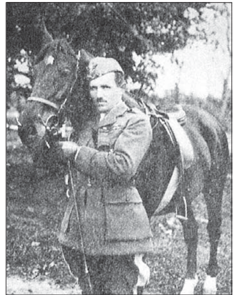
Ген. Станіслаў Булак-Булахавіч

Трэцяга чэрвеня 1920 года Балаховіч ў складзе польскіх войск пачаў ваенныя дзеянні на Украіне ў ва-