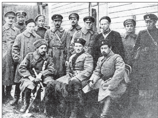
Ген. Станіслаў Булак-Балаховіч (сядзіць пасярэдзіне) са сваім штабам

Увесь гэты час аддзелы Балаховіча знаходзіліся ў Эстоніі на ўтрыманні эстонскага ўраду, які разглядаў звязаны з гэтым выдаткі, як пазыку ўраду БНР. Але хутка Эстонія пачала мірныя перамоў з Савецкай Расеяй і для беларусаў найважнейшай справай стаў пошук новага месца дыслакацыі аддзелаў Балаховіча ў тых дзяржавах, якія працягвалі вайну з Расеяй.