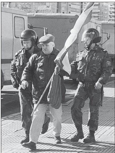
Аднаго з удзельнікаў мітынга затрымалі за карыстанне незарэгістраванай сімволікай. Менск, 25 сакавіка 2001г., Дзень Волі.