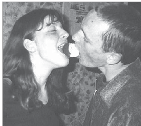
Беларускія Ева і Адам знайшлі свой яблык