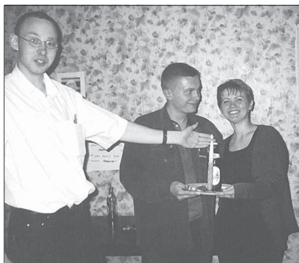
Узнагароджванне ідэальнай пары вечара